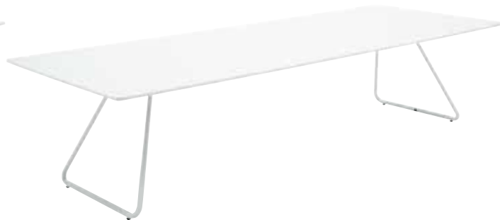
天板: 白/フレーム: 白