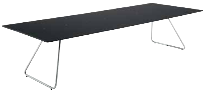
天板: 黒/フレーム: クロームメッキ