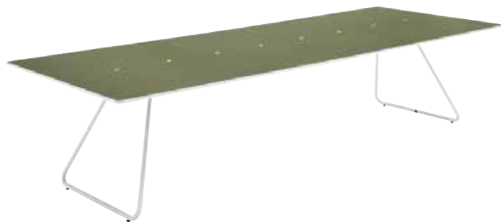
天板: オリーブ/フレーム: 白