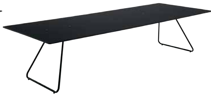
天板: 黒/フレーム: 黒