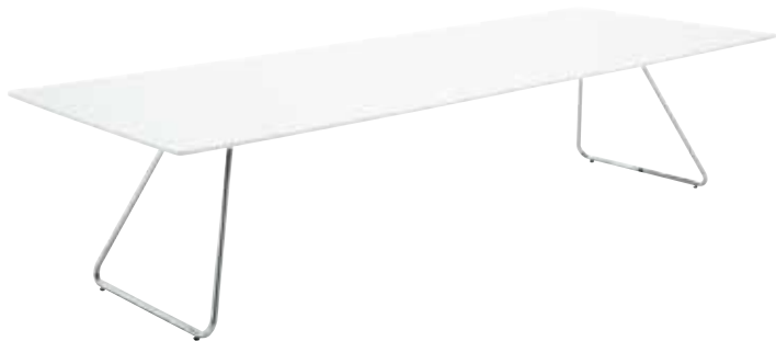
天板: 白/フレーム: クロームメッキ